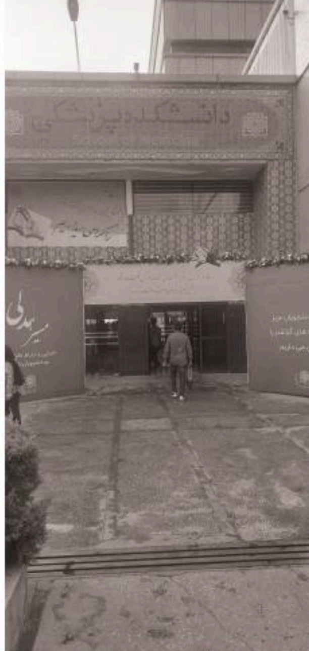
در انتظار نودانشجویان

آخرین عکس از ازدحام شدید دانشجویان سالن تشریح که توسط عکاسان نشریه "بهشتی" در سال ۱۴۰۱ گرفته شده است.